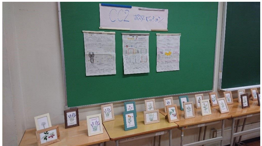
展示・ポスター発表