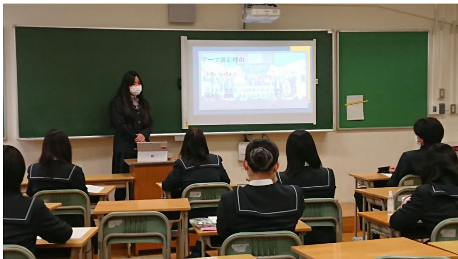
↑ 発表の様子 ↓

専攻ごとに、あるいは生徒ごとに、様々な特色があり、個性豊かな研究発表を大いに楽しみました。この課題研究発表会が、生徒たちの『葛総力』をさらに高め、その力で、将来社会に羽ばたいて行くための大きな飛躍のきっかけとなることを期待しています。