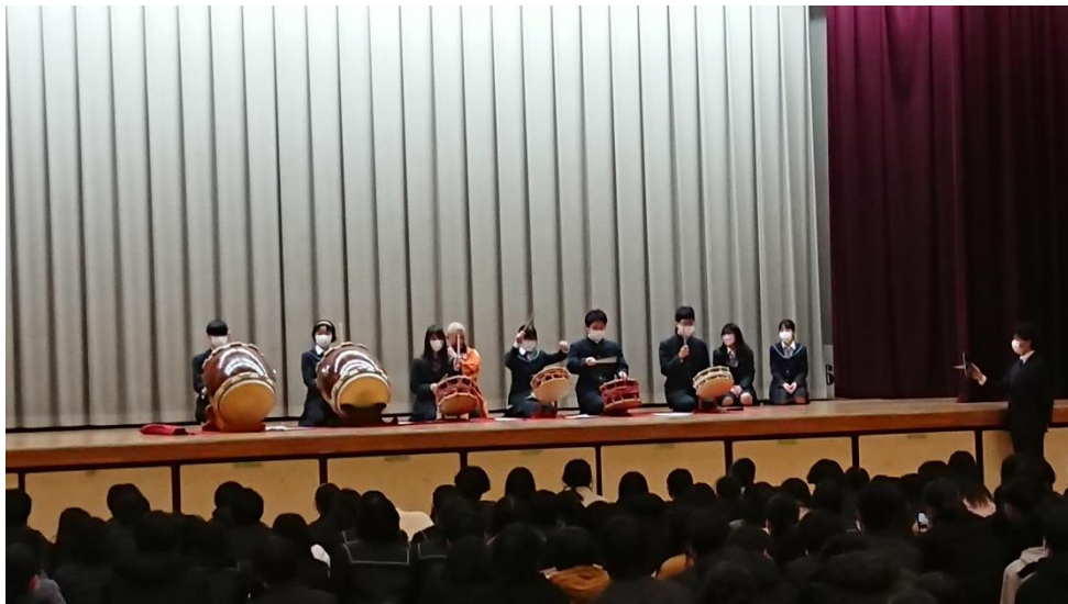
日本の伝統と文化