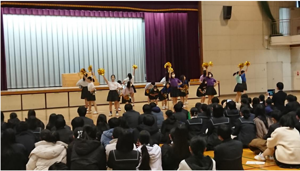
ダンス (チアリーディング)