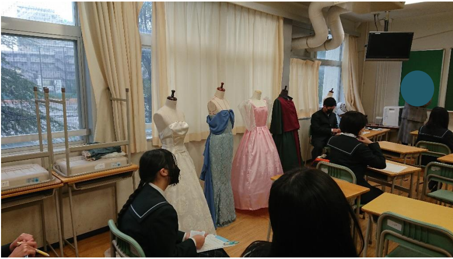
課題研究の作品展示